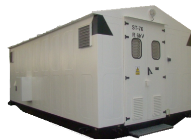
Stacja SKP - Oddział KWB Bełchatów SKP substation - Department of KWB Bełchatów

BIURO ZARZĄDU MANAGEMENT OFFICE ul. Porcelanowa 12 40-246 Katowice tel.: +48 32 888 63 63 biuro@elektrobudowa.com.pl