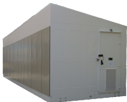
Pojedynczy segment stacji SKP przygotowany na czas transportu Single segment of SKP station prepared For transportation