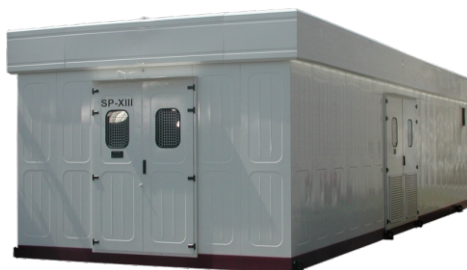
Stacja SKP Port Lotniczy Okęcie Warszawa SKP substation Airport Okęcie Warsaw